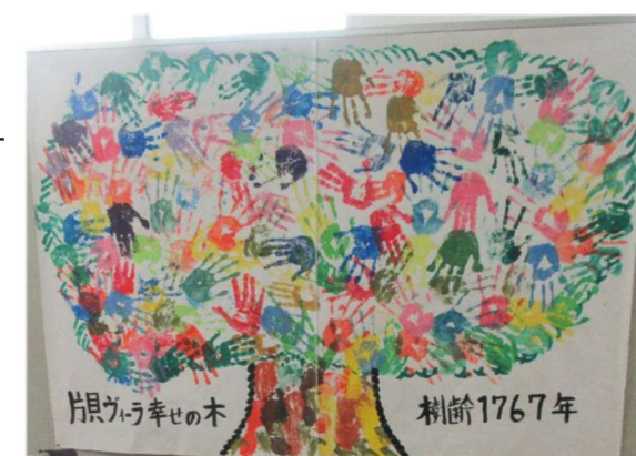
文化祭の合同作品